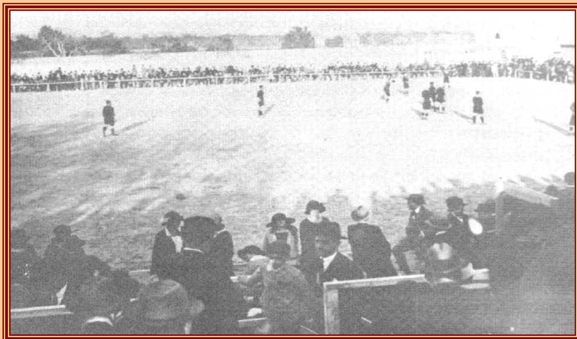
El football levantaba ya gran expectación

Pasados unos años sin continuidad de la “Semana Deportiva”, encontramos otros testimonios de la marcha de los deportes.