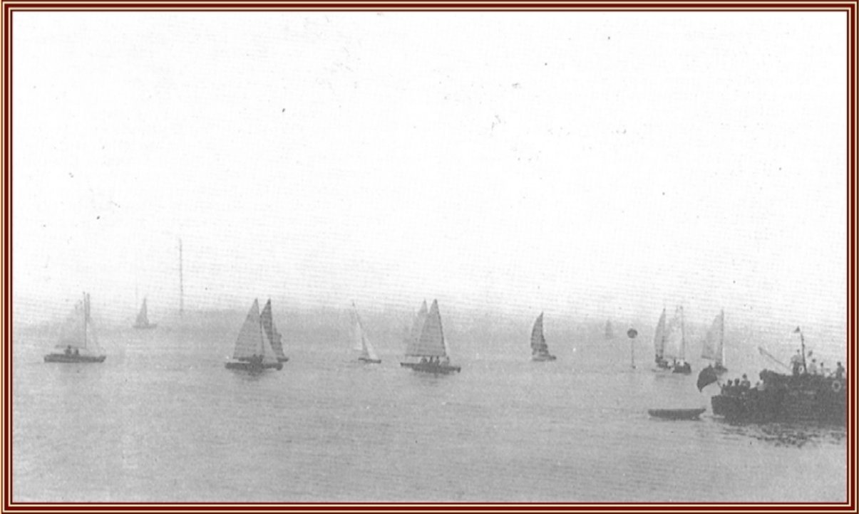
Regatas en la bahía de Palma

La “Semana Deportiva” contribuyó eficazmente a un mejor conocimiento y promoción de los que se practicaban. Se contaba con un velódromo y un hipódromo – el mar era un palenque natural y gratuito – y, aparte de sus deportes, servían de escenario para otros y se despertaba del secular letargo.